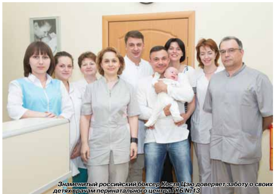
Знаменитый российский боксер Костя Цзю доверяет заботу о своих детях врачам перинатального центра ГКБ №13